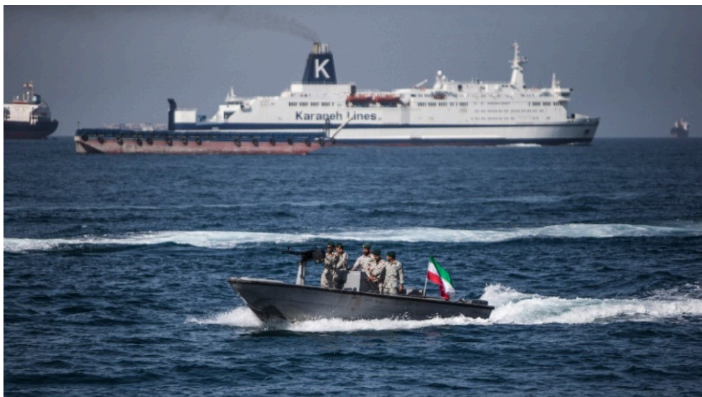
伊朗衝突爆發致霍爾木茲海峽航運受阻。