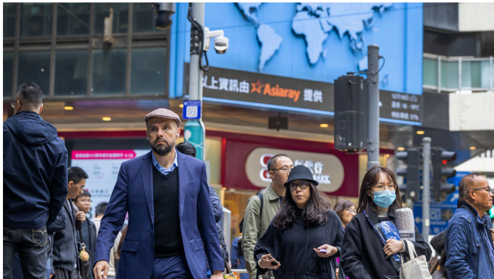
特區政府的財政收入過於單一。