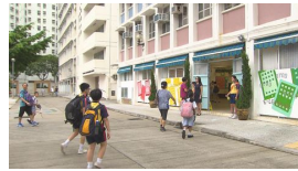
【時事多面睇】有學校被指無將資助用於特殊教育學童 團體倡監察公帑運用 港澳 2024-12-20