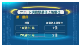
港交所落實下調股票最低上落價位 業界指對提升市場成交量作用不大 財經 2024-12-17