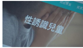
【時事多面睇】與網上活動相關青少年及兒童性侵害案增加 逾七成受害者為女性 港澳 2024-12-23