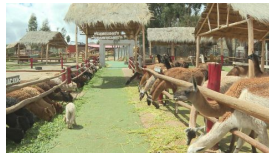
【時事多面睇】秘魯商界冀引入更多中國資金及技術 提升工業發展及創造就業 兩岸 2024-12-25