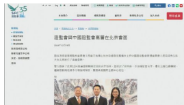
香港證監會與中證監高層北京會面 探討優化互聯互通機制等 財經 2024-12-19