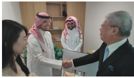
【時事多面睇】沙特商界指當地經濟具龐大增長潛力 提醒投資者勿急於求成 港澳 1天前