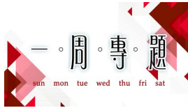
【一周專題精選】12月14日至12月20日 港澳 2024-12-21