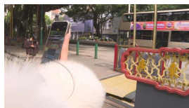
【時事多面睇】政府撥款設打卡地標等提振地區經濟 學者指應訂績效指標 港澳 2024-12-18