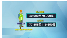
【時事多面睇】學者指公務員減薪對改善財赤成效有限 倡改革編制精簡人手 港澳 2024-12-19