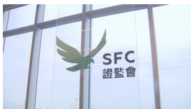
證監會按迅速發牌程序向四間虛擬資產交易平台發牌 財經 2024-12-18